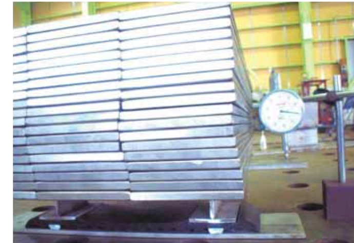
内面バンドゴムの载荷重と圧縮量測定